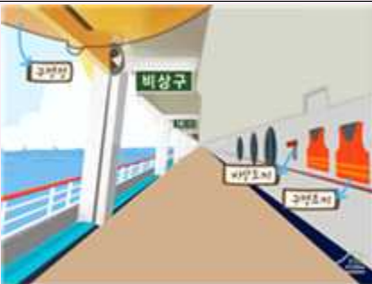
<그림1. 탈출로 및 구명조끼 확인>