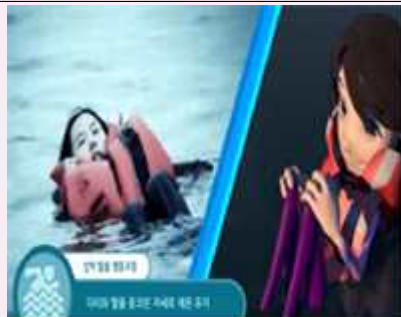
<그림2. 물속에서 체온유지>